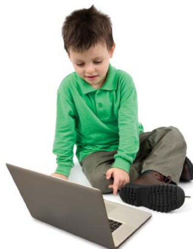
TABLE DE CONCERTATION POUR LES ENFANTS AYANT DES BESOINS PARTICULIERS EN MAURICIE-CENTRE-DU-QUÉBEC. De la petite enfance vers le préscolaire – Une transition ( http://www.rcpe04-17.com ).